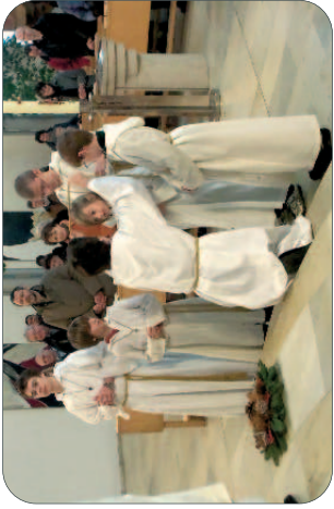
Ministrantenaufnahme am Christkönigsontag