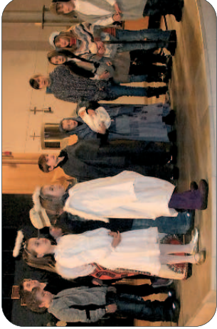
Krippenspiel in Emmaus