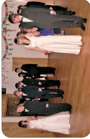
Eröffnungskomitee des Pfarrballs 2011