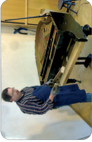
Unser Klavier wurde repariert