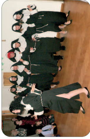
Auch für lustige Einlagen wurde am Pfarrball gesorgt