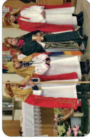
Unsere Sternsinger machten sich wieder auf den Weg