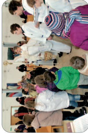
Der Nikolaus besucht die Kinder in der Kirche