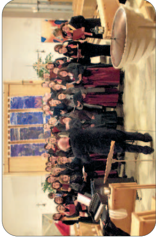
Adventkonzert der Pfarre Emmaus und der Chorgemeinschaft Wimpassing